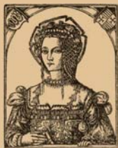
IN BONAE REGINAE EFFIGIEM

A że była to wyjątkowa królowa Światła, hojna i na owe czasy postępową Razem z mężem kościół ufundowała I miastu prawa magdeburskie dała